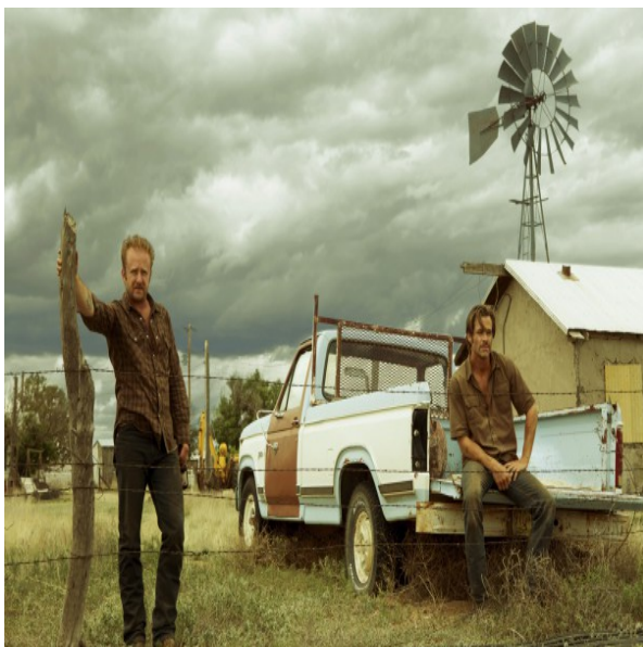
Ben Foster et Chris Pine

Course-poursuite entre deux braqueurs et un vieux shérif au Texas. Un programme classique brillamment exécuté.